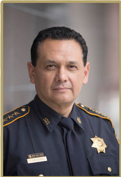
Alguacil Ed Gonzalez

Estos son algunos consejos que le ayudarán a hacer sus compras durante esta temporada, y durante todo el año, de una manera más segura.